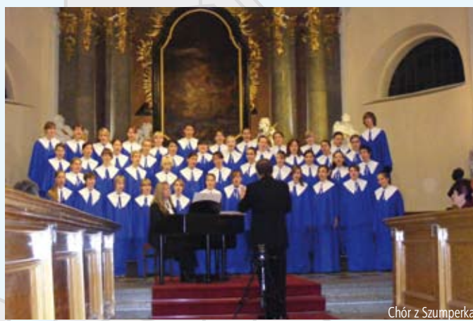
Chór z Szumperka