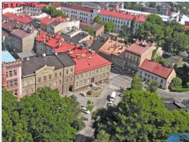
Plac Kościelny, widok z wieży kościelnej, 2004