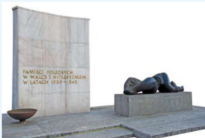
Pomnik Ofiar Hitleryzmu, 2008

W 400 – lecie urodzin, staraniem cieszyńskiego oddziału Polskiego Towarzystwa Ewangelickiego wystawiono pomnik „Ślązakowi Cieszyńskiemu”, twórcy cennego kancjonału „Cithara sanctorum” – ks. Jerzemu Trzanowskiemu. Pieśni z tego kancjonału rozbrzmiewały aż do początków XX w. w kościołach i domach ewangelickich na terenie Czech, Słowacji i na Śląsku Cieszyńskim.